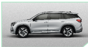
Brilliant Silver - 500 €