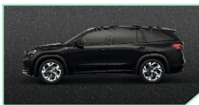
Magic Black - 500 €