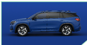
Energy Blue - 0 €