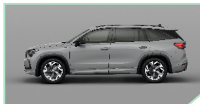
Steel Grey - 500 €