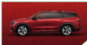
Velvet Red - 800 €