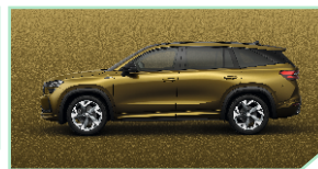
Bronx Gold - 500 €