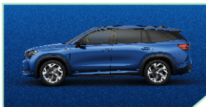
Race Blue - 500 €