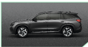
Graphite Grey - 500 €