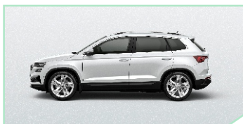
Moon White - 400 €