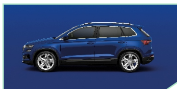
Energy Blue - 0 €