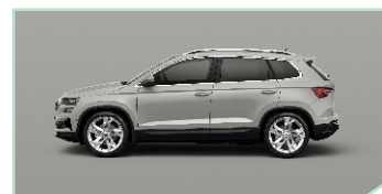
Steel Grey - 400 €