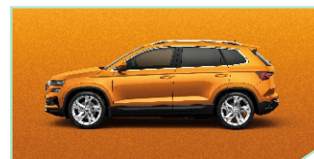
Phoenix Orange - 600 €