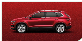
Velvet Red - 600 €