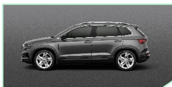
Graphite Grey - 400 €