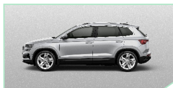
Brilliant Silver - 400 €