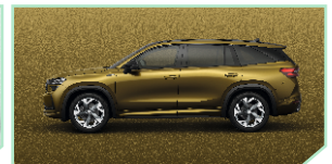
Bronx Gold - 500 €