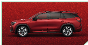
Velvet Red - 800 €