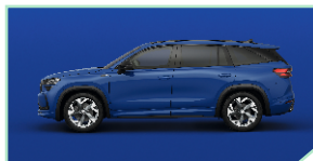
Energy Blue - 0 €