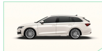
Candy White - 400 €