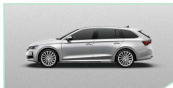
Brilliant Silver - 400 €