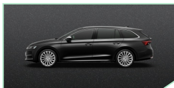
Magic Black - 400 €