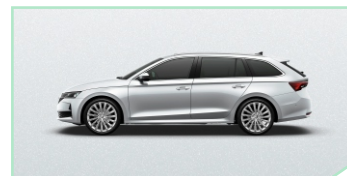
Moon White - 400 €