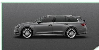
Graphite Grey - 400 €