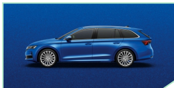
Race Blue - 400 €