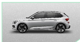
Brilliant Silver - 400 €