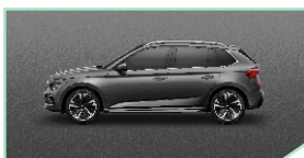
Graphite Grey - 400 €