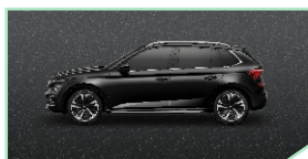
Magic Black - 400 €