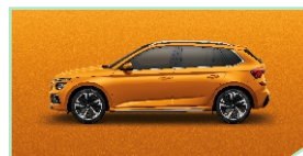
Phoenix Orange - 500 €