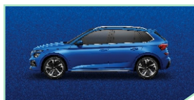
Race Blue - 400 €