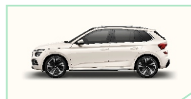
Candy White - 200 €