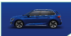
Energy Blue - 0 €