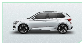
Moon White - 400 €